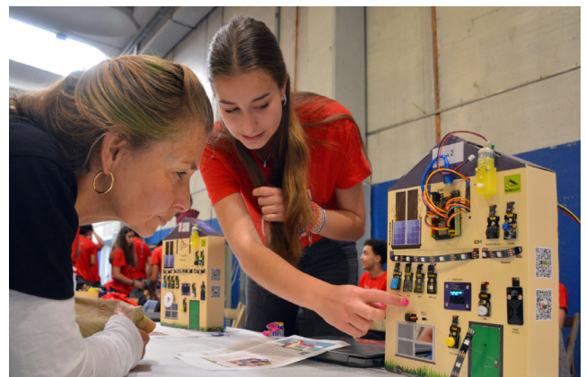
Programació i robòtica educatives