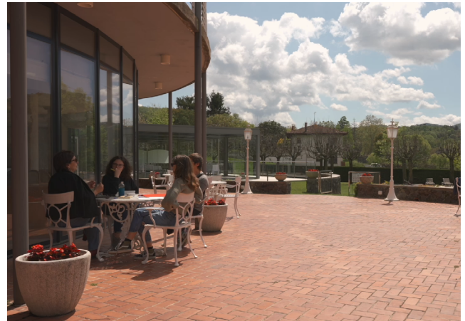
Debats entre els participants de l'estada de sostenibilitat ambiental.