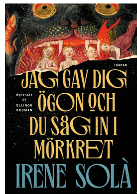
Traducció al suec del llibre Et vaig donar ulls i vas mirar les tenebres