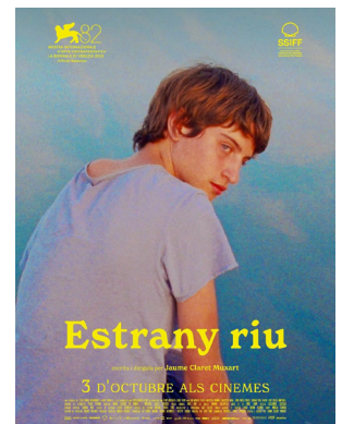
Cartell de la pel·lícula Estrany riu .