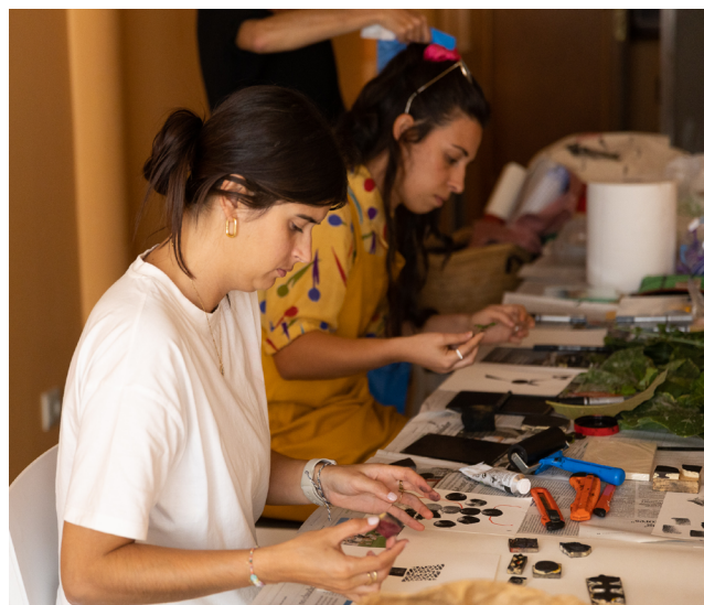
Estada d'il·lustradores per col·laborar amb editorials internacionals.