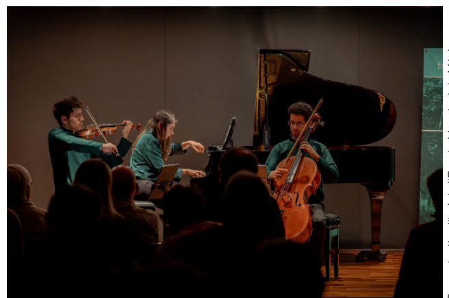
Concert a l'auditori de l'Escola Municipal de Música.