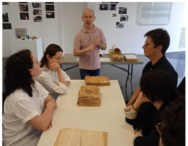
Investigadors medievalistes visiten l'Arxiu Comarcal de la Garrotxa.