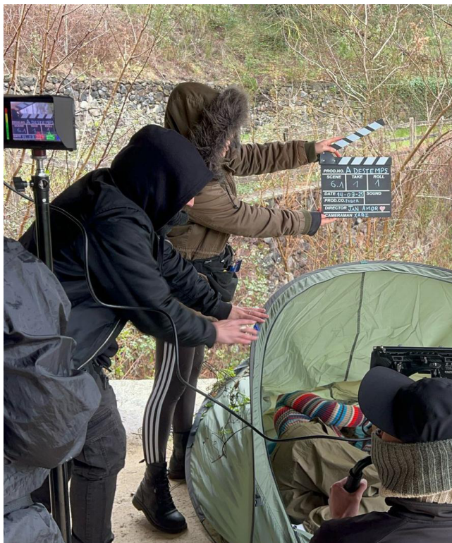
Hackató. Residència de cinema per joves talents